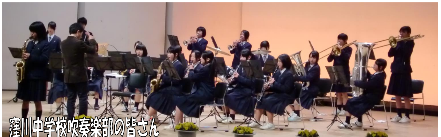
窪川中学校吹奏楽部の皆さん