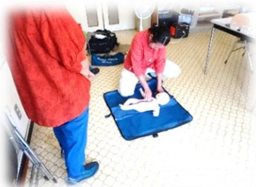
まかせて会員講習会