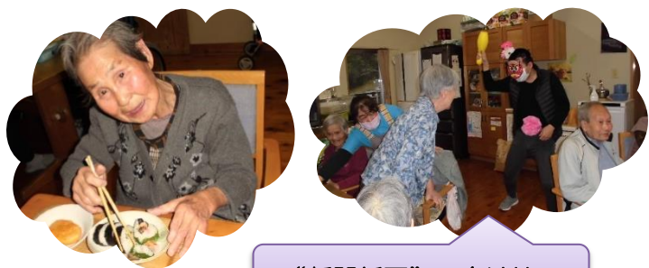
グループホームひだまり