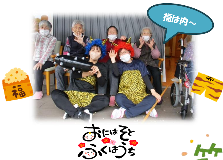
小規模多機能ホーム香月