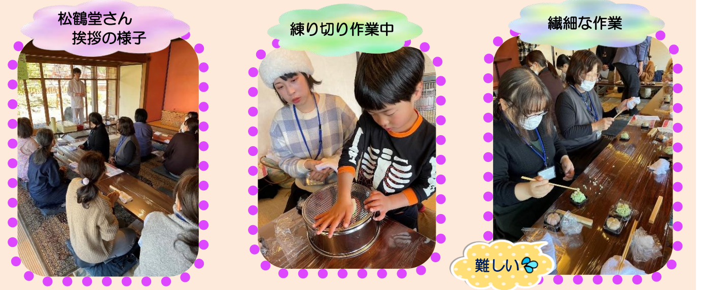
松鶴堂さん 挨拶の様子