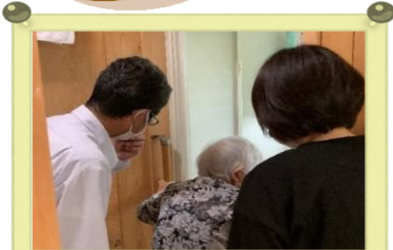
住宅環境の確認中