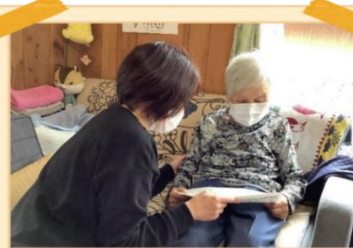
生活状況のお話などを聞かせて頂き、利用予定の確認をして貰っています

ケアマネジャーは、介護を必要とする方が介護保険サービスを受けられるように、ケアプラン(サービス計画書)の作成や関係市町村・サービス事業者等との調整や連携を図り、望まれるご自宅での生活が送れるように支援させて頂きます。お気軽にご相談下さい。